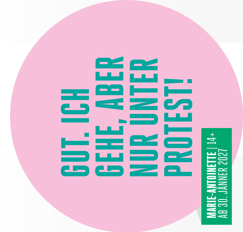
GUT. ICH GEHE, ABER NUR UNTER PROTEST!

➔ ➔ ➔ ROMEO UND JULIA SEI DABEI! TRAGÖDIE NACH WILLIAM SHAKESPEARE ab 17. Oktober 2026 | Schauspielhaus