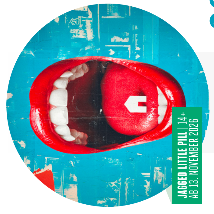
JAGGED LITTLE PILL | 14+ AB 13. NOVEMBER 2026

➔ ➔ ➔ LUISA MILLER SEI DABEI! MELODRAMA TRAGICO IN DREI AKTEN VON RUISSPE VERO! ab 5. Dezember 2026 | Großer Saal Musiktheater